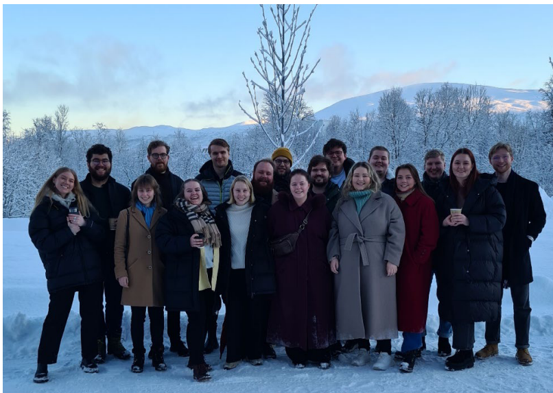
Arbeidsutvalgene i U5 på omvisning på campus Breivika

63 opptaksleder som holdt en innledning for oss. Hovedmomenter fra denne bolken vil 64 presenteres for Studentparlamentet i en egen diskusjonssak om opptakssystemet. 65