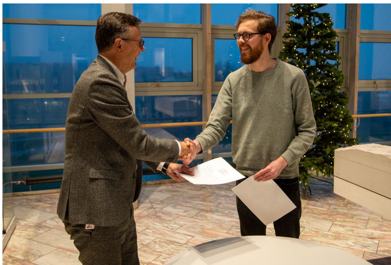
Et håndtrykk etter avtalesignering mellom avtalepartnerne